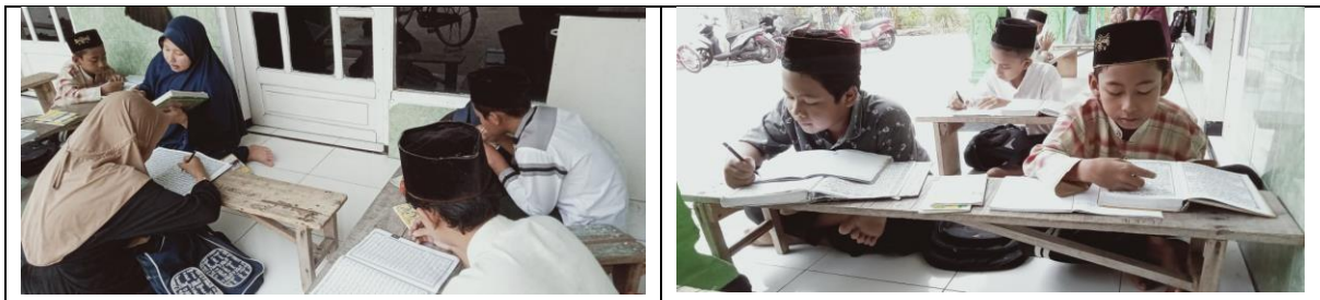
Gambar 1. Pelaksanaan Kegiatan Pendampingan Pembelajaran Al-Qur'an

Pelaksanaan kegiatan pengabdian kepada masyarakat berupa pendampingan pembelajaran Al-Qur'an di TPQ Darut Taufiq Kabupaten Sidoarjo dilaksanakan melalui beberapa tahapan, yaitu perencanaan, pelaksanaan pendampingan, observasi, dan evaluasi. Kegiatan pendampingan dilaksanakan selama periode program pengabdian dengan melibatkan santri TPQ sebagai sasaran utama kegiatan.